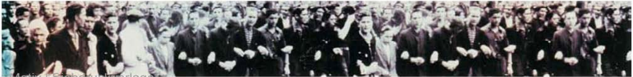
Motiv | Siebdruckvorlage

Ein Denkmal zur Erinnerung an die Ereignisse des siebzehnten Juni neunzehnhundertdreundfünfzig. Einer der zentralen Orte politischen Aktionen war der Vorplatz des damaligen Hauses der Minister, dem heutigen Bundesministerium der Finanzen. Das horizontale Glasbild, 24 x 3 m groß, hat ein dokumentarisches Foto vom 17. Juni 1953 zur Grundlage. Das Bild ist im Siebdruckverfahren hergestellt und auf die Glasscheiben gedruckt. Durch eine zweite, darunter liegende Bildebene, ist das gesamte Bild in Folge der Parallaxe immer nur teilweise scharf zu stellen.