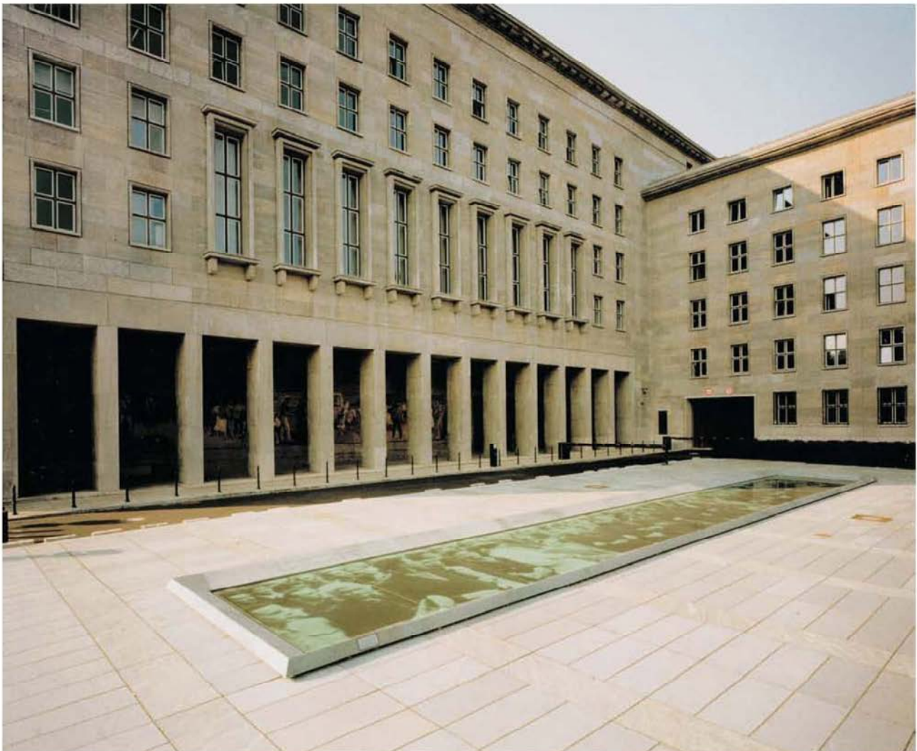
Das Denkmal vor dem Bundesministerium der Finanzen | Berlin