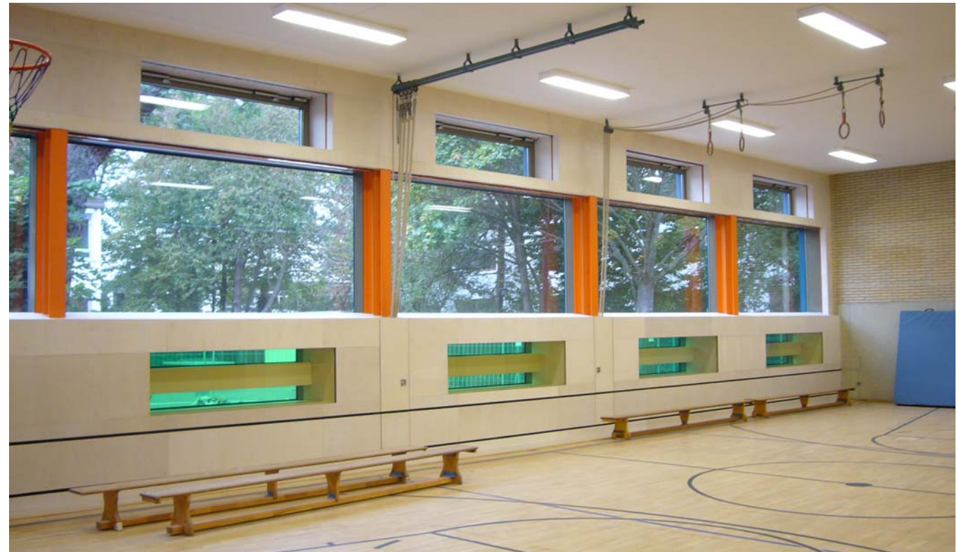
Fassadeninnenansicht | Trunhalle | Fertigstellung