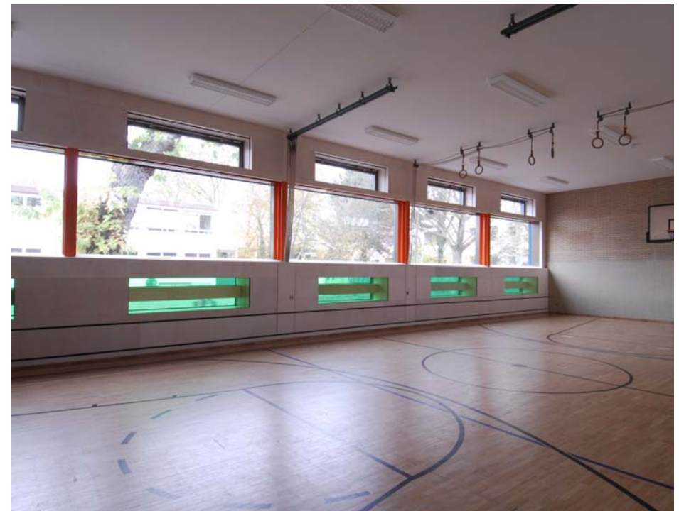
Turnhalle | Fertigstellung

Grundschule Balsaminenweg Fassadensanierung | Dachsanierung Balsaminenweg 52 | 50769 Köln | 2009