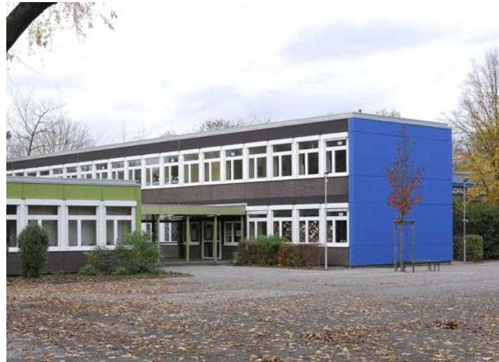
Schule | Vorderansicht | Fertigstellung