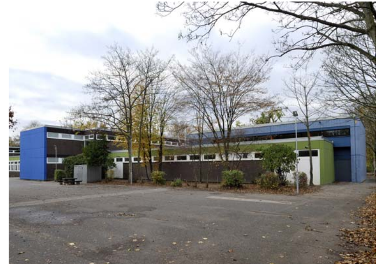
Schule | Rückansicht | Fertigstellung